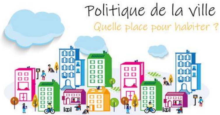
Table ronde : Démolition et relogement, outil ou contrainte pour nos territoires ? L'exemple de la métropole stéphanoise