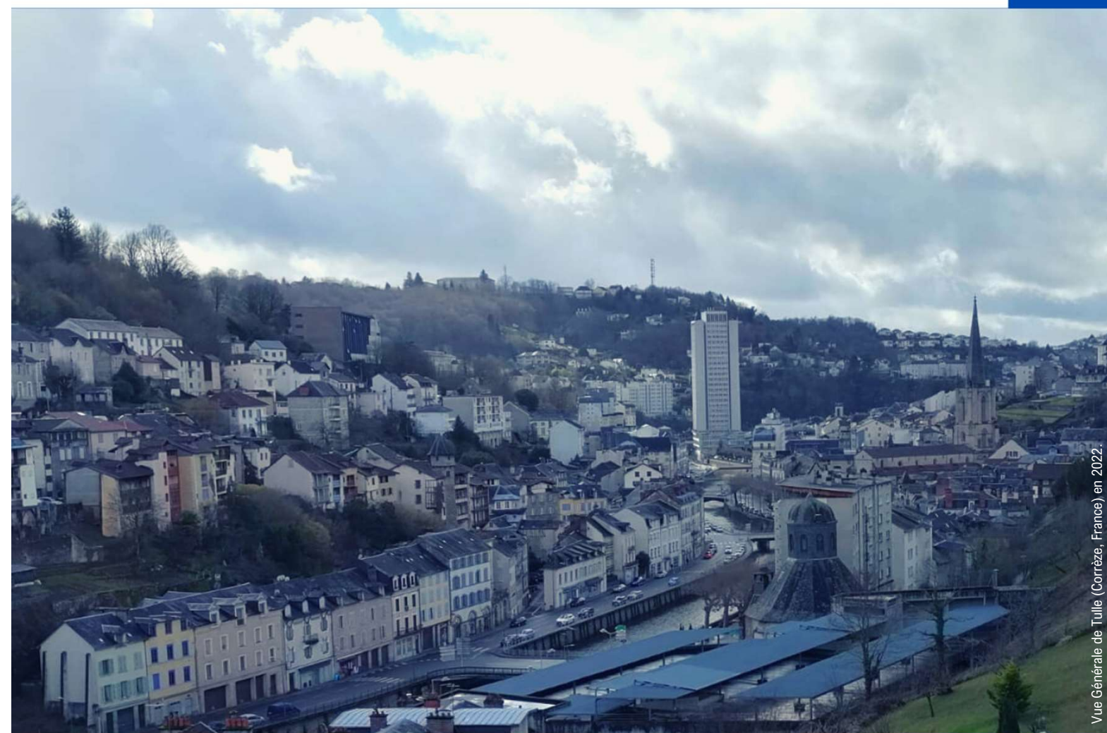
Vue Générale de Tulle (Corrèze, France) en 2022.