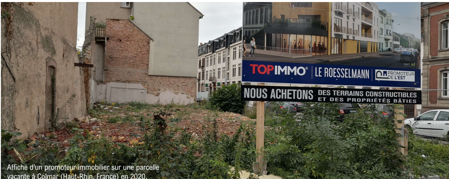
Affiche d'un promoteur immobilier sur une parcelle vacante à Colmar (Haut-Rhin, France) en 2020.

Grâce à nos partenaires, l'inscription aux journées d'études est gratuite mais obligatoire au lien suivant .